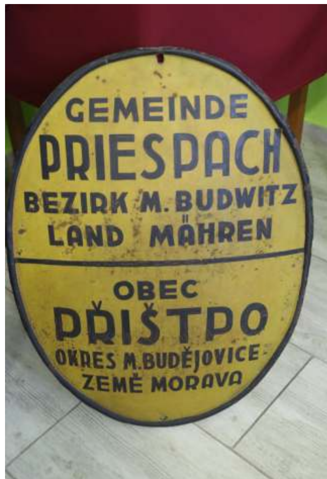
Jedno z prvních názvů obce